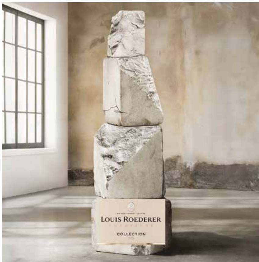
LOUIS ROEDERER HAND IN HAND WITH NATURE